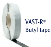
VAST-R® Butyl tape